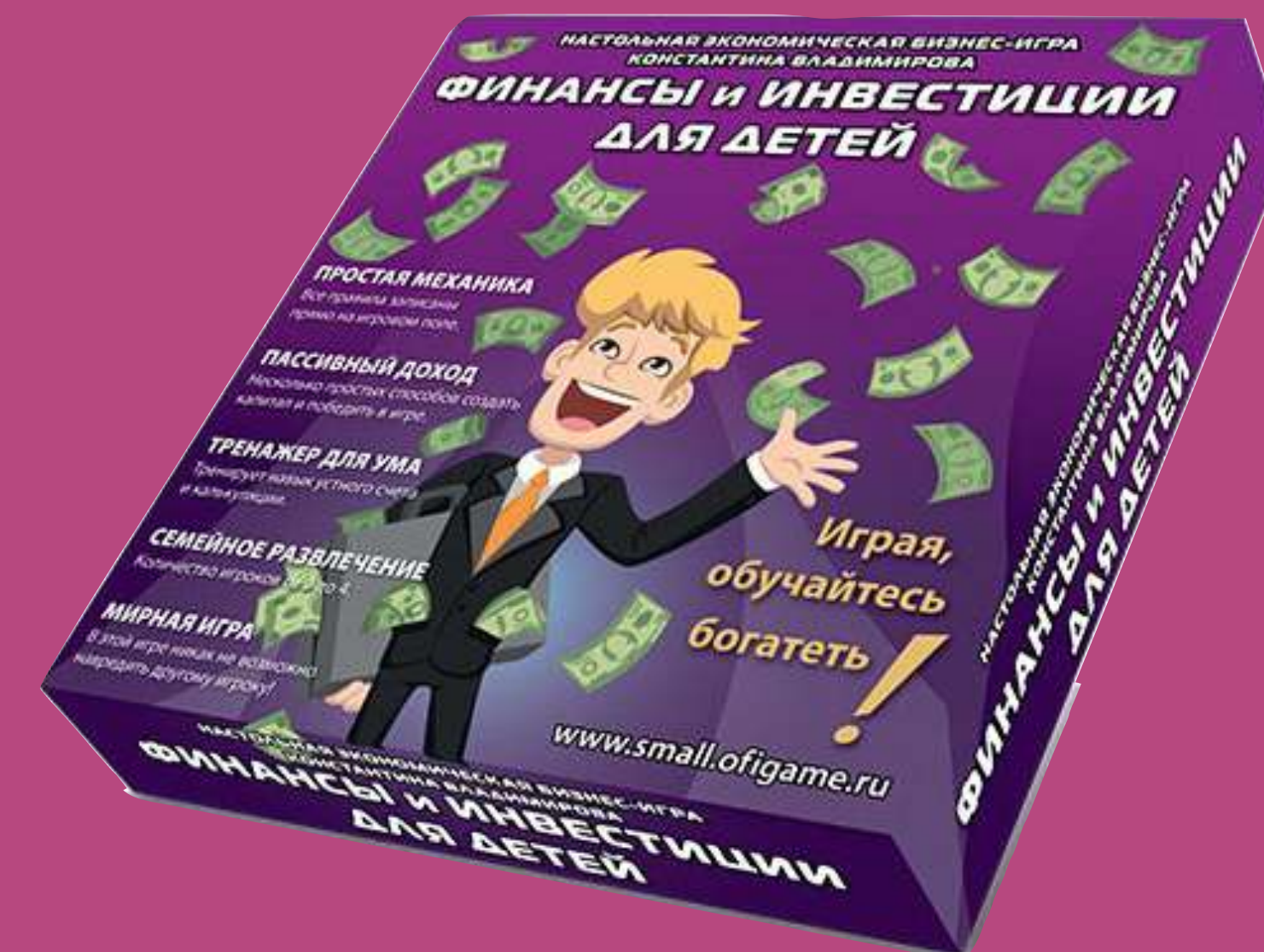
ФИНАНСЫ И ИНВЕСТИЦИИ ДЛЯ ДЕТЕЙ