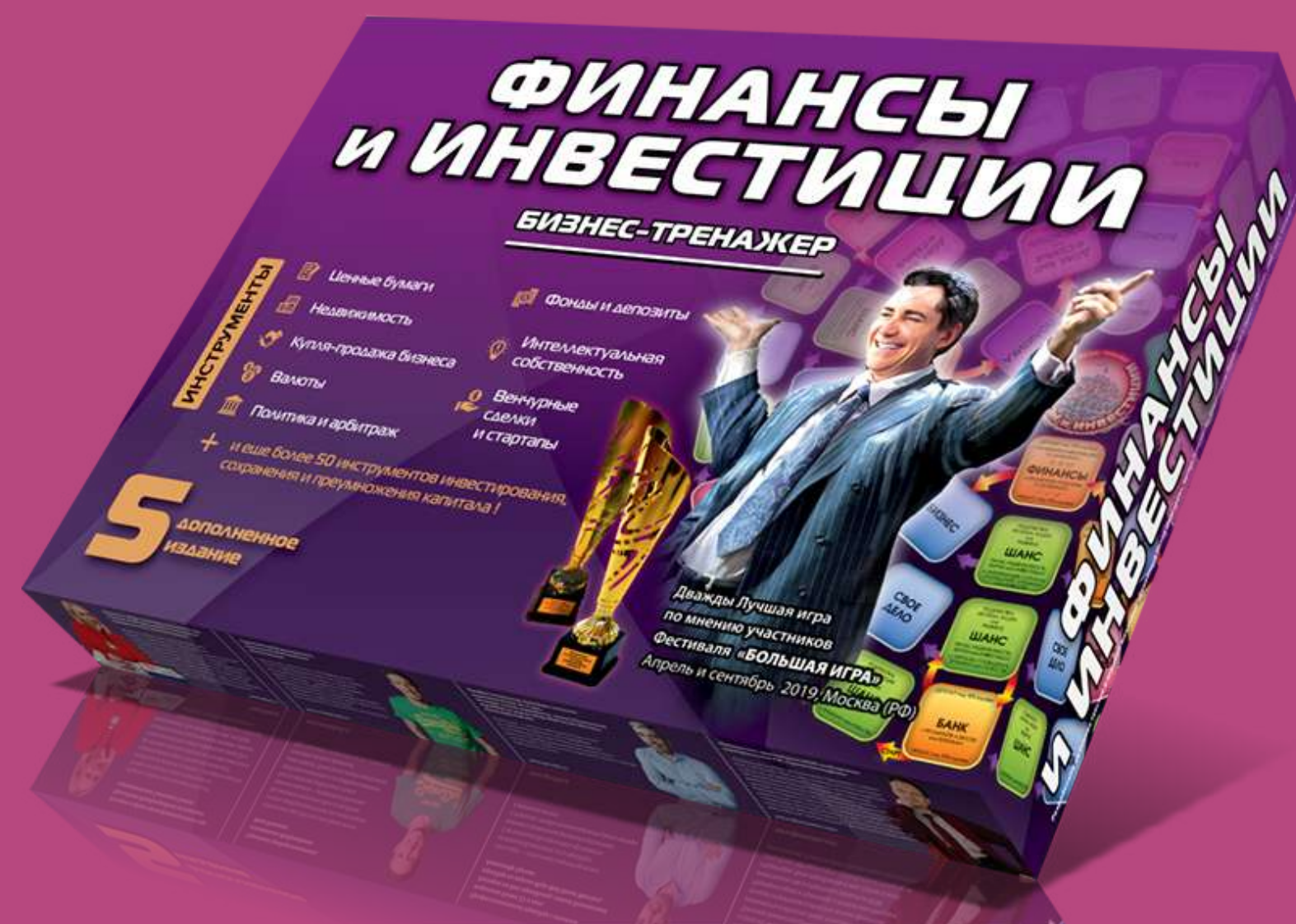
ФИНАНСЫ И ИНВЕСТИЦИИ / ДЕНЕЖНЫЙ ПОТОК ОЛИГАРХА