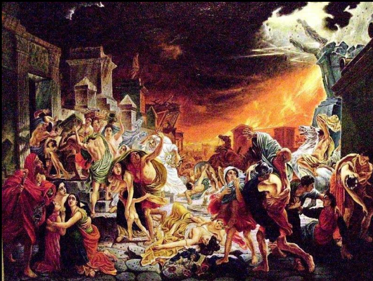
Карл Брюллов «Последний день Помпеи» 1833, холст, масло